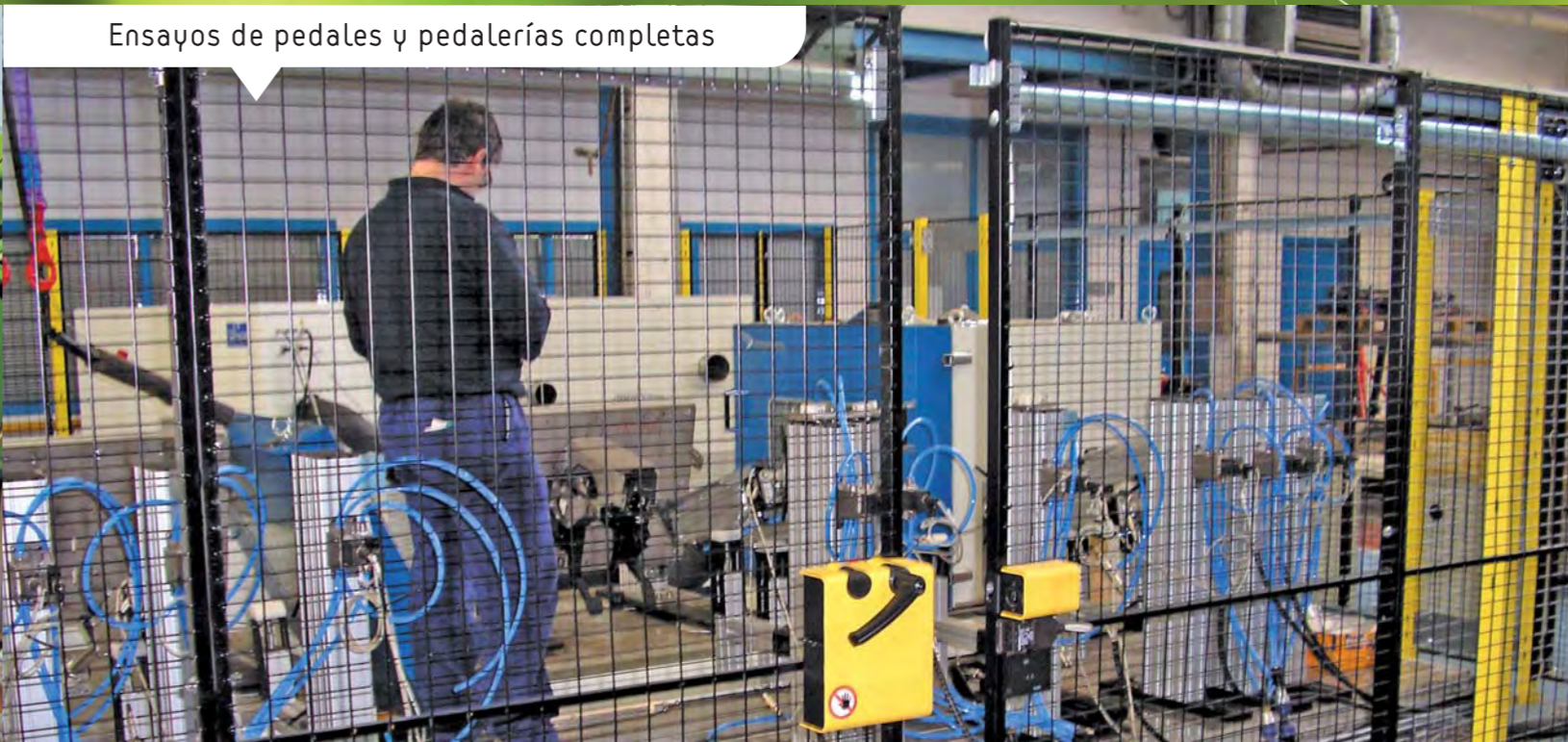
Ensayos de pedales y pedalerías completas