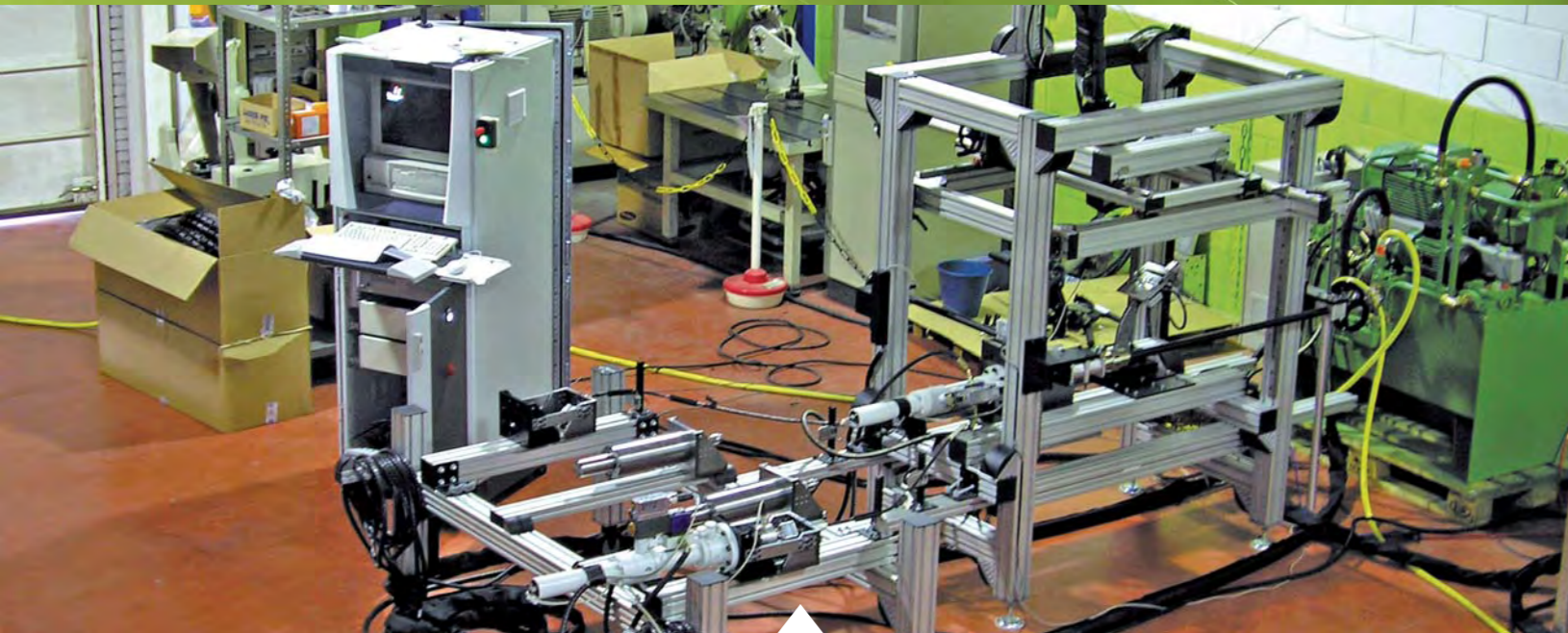
Ensayos de sistemas de freno de mano.

Posibilidad de cesión de equipos en régimen de renting.